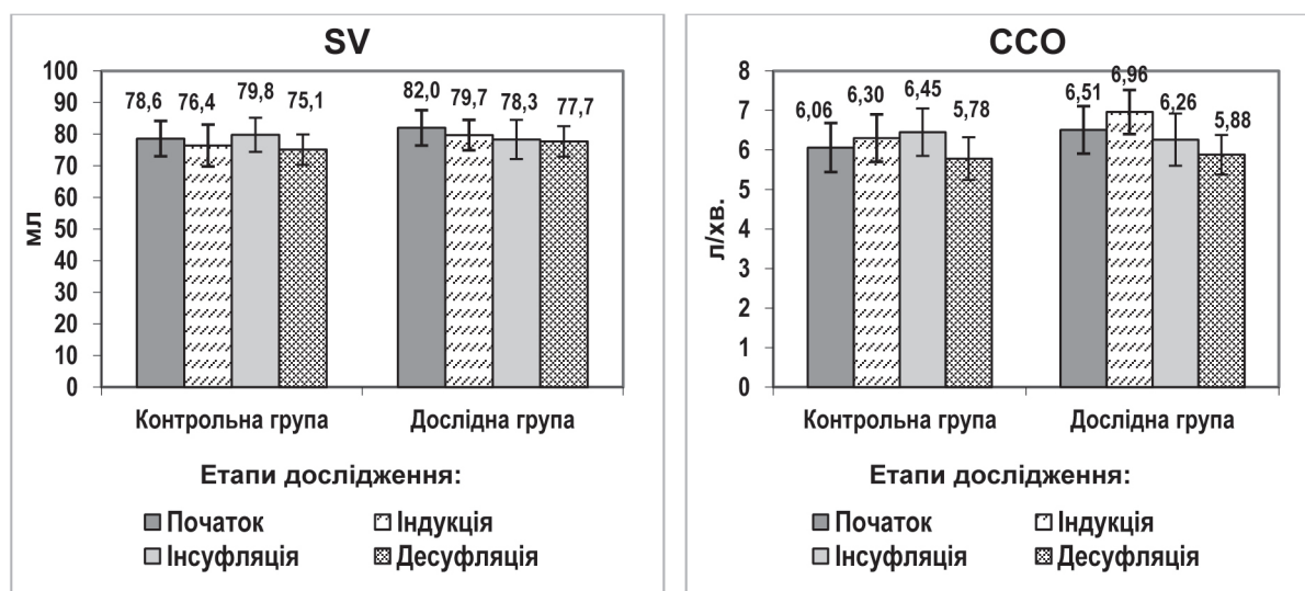
Рисунок 1 – Порівняльна динаміка середніх показників (М, 95 % ДІ) ударного об'єму (SV) і серцевого викиду (CCO) в групах дослідження (р>0,05 між групами на усіх етапах).

ності: F=3,35, p=0,025 і F=6,21, p=0,001, відповідно по групах.